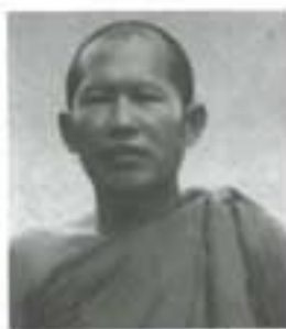
พระสุบิน ปกติโต