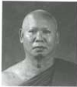
พระครูมกนโสนทีพิกัษ์