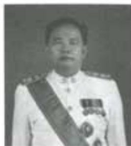
ศาสตราจารย์เกียรติคุณ มณี พยอมยงค์