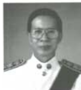
ศาสตราจารย์ ดร.อุดม รุ่งเรืองศรี