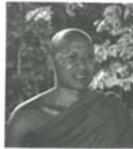
เจ้าอธิการสมคิด จรดชมโม