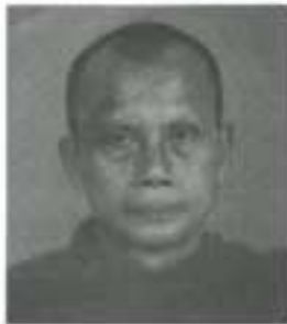
พระพิศาลธรรมหาคี