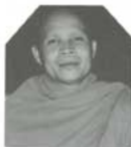
พระศรีพัชรินโรจน์